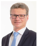
Bernd Sibler Bayerischer Staatsminister für Wissenschaft und Kunst